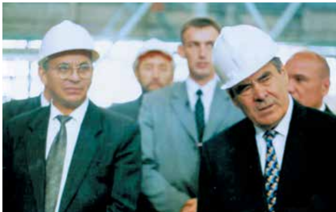
▲ Президент РТ М. Ш. Шаймиев на Заводе по изготовлению тьюбингов, 1999 г.

Работа на обширных площадях КПСК была развернута огромная: уникальные мощные дробильно-сортировочные станции очищали, промывали и измельчали щебень для производства специфического бетона. Там же размещались завод металлоизделий и линия по изготовлению керамзита, а также крупнейший в республике цех столярных изделий. В течение полугода, работая в таком режиме, удалось погасить долги по зарплате, а затем где-то в течение двух лет ликвидировать и налоговую задолженность.