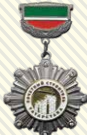
НАГРУДНЫЙ ЗНАК «ПОЧЕТНЫЙ СТРОИТЕЛЬ ТАТАРСТАНА»