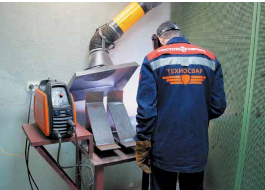
▲ Сварка на участке «ЦПР «Техносвар»