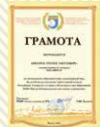
ГРАМОТА СОЮЗА СТРОИТЕЛЕЙ РЕСПУБЛИКИ ТАТАРСТАН