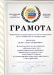
ГРАМОТА РОССИЙСКОГО СОЮЗА СТРОИТЕЛЕЙ