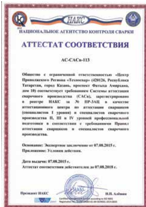
▲ Аттестат соответствия «ЦПР «Техносвар»

Строительная отрасль, без сомнения, является одной из важнейших и наиболее динамично развивающихся в экономике нашей республики. Устойчивый рост количества объектов жилищного строительства, активное возведение уникальных зданий для проведения международных мероприятий высокого уровня требуют привлечения большого количества строительных организаций. В таких условиях достаточно остро встает вопрос контроля за соблюдением правил безопасности и выполнением работ на объектах строительства.