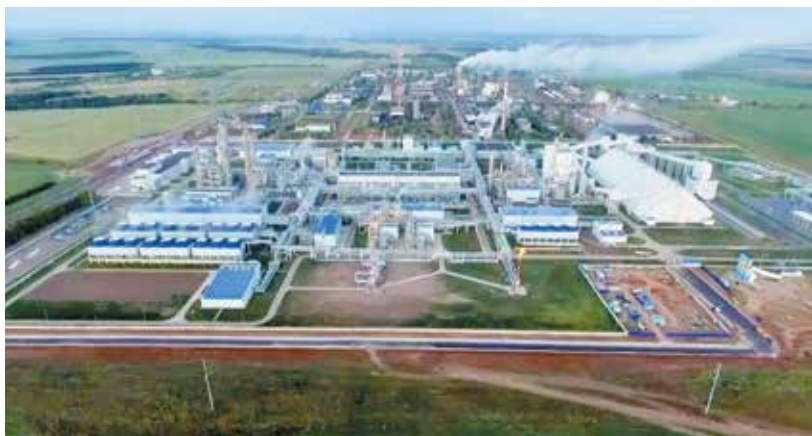
▲ Комплекс по производству аммиака, метанола и гранулированного карбамида АО «Аммоний»

Искренне желаю Вам сохранять высокую энергию, которая столь необходима для выполнения ответственной и трудоемкой работы руководителя министерства! Здоровья и всего самого доброго Вам и Вашим близким!