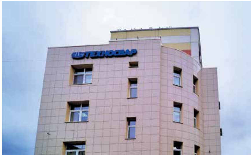
▲ ЦПР «Техносвар»

Аттестационный центр «ЦПР «Техносвар» давно занимается проблемами сварки в строительстве. За прошедшие годы была отлажена процедура аттестации сварщиков-строителей с учетом специфики, имеющейся в данной сфере. ЦПР «Техносвар» располагает современной учебно-производственной базой и квалифицированными специалистами, которые не только обеспечивают неизменно высокое качество аттестационных процедур, но и могут предоставить методическую и консультационную поддержку в части производства сварки на строительных объектах.