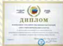
ДИПЛОМ РОССИЙСКОГО СОЮЗА СТРОИТЕЛЕЙ