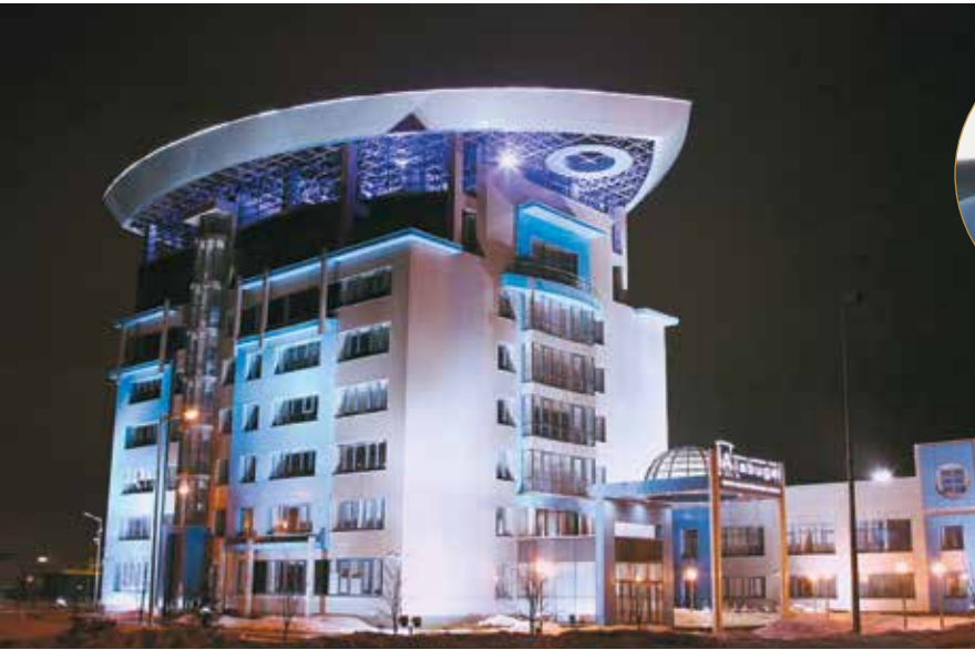
▲ Административно-деловой центр ОЭЗ «Алабуга»

От всей души желаю Вам крепкого здоровья и семейного благополучия. Воплощения всего задуманного и новых профессиональных побед!