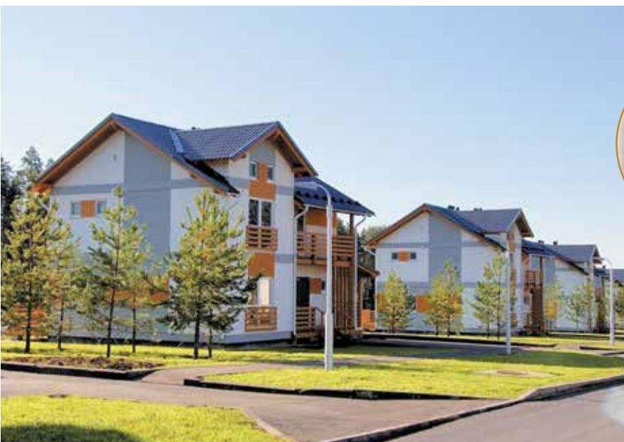
▲ Коттеджный поселок «Три медведя»

По случаю юбилея примите от меня наилучшие пожелания: здоровья, семейного благополучия, достойных друзей и воплощения в жизнь всего задуманного!