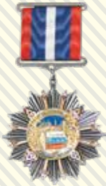
ОРДЕН «ЗА ЗАСЛУГИ В СТРОИТЕЛЬСТВЕ»