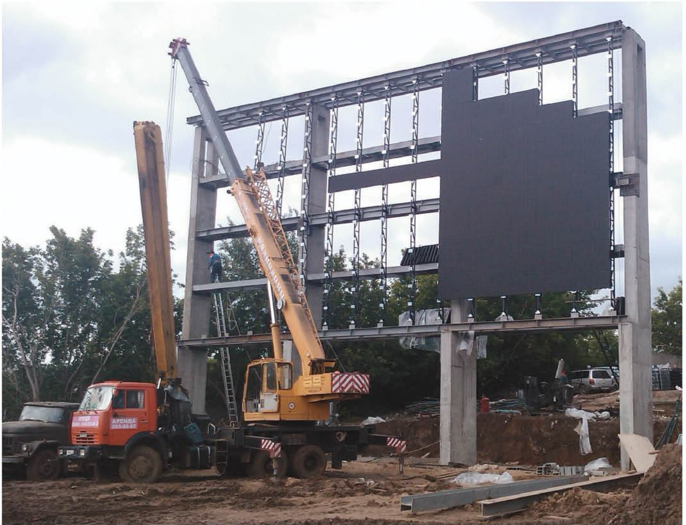
Работы по оснащению Центра гребных видов спорта светодиодным экраном.

назначения, для прочих развлекательных мероприятий.