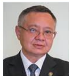
ИРЕК ФАЙЗУЛЛИН, министр строительства, архитектуры и жилищно-коммунального хозяйства РТ