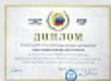
Диплом Российского Союза строителей