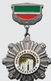
Нагрудный знак «Почетный строитель Татарстана»