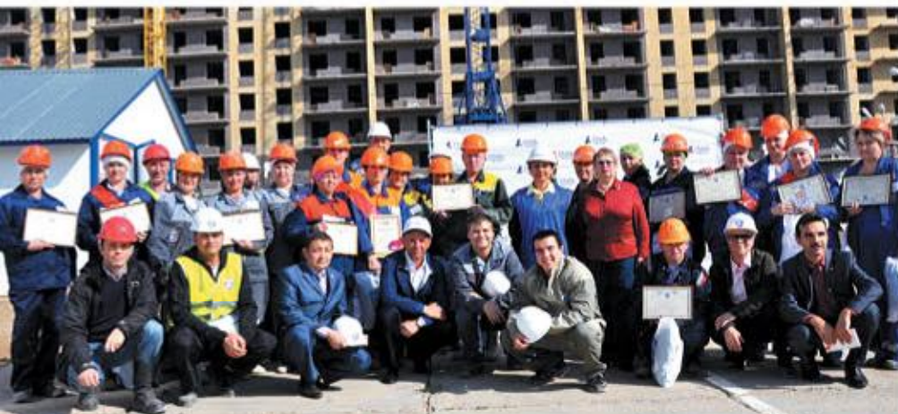
Участники и организаторы конкурса штукатуров, сентябрь 2014 г.

– Мы продолжим работу во всех перечисленных направлениях. Уверен, что это позволит нам достичь еще более эффективных результатов в развитии саморегулирования, совершенствовании работы строительного комплекса республики и повышении престижа профессии строителя.