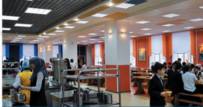
Татарская гимназия №2 им. Ш. Марджани после капитального ремонта, выполненного ЗАО «Ремонтстройсервис» в 2014 г.