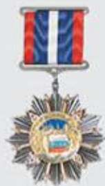
Орден «За заслуги в строительстве»