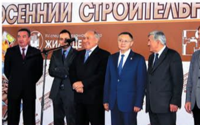
На открытии XVI Осеннего строительного форума, сентябрь 2014 г.