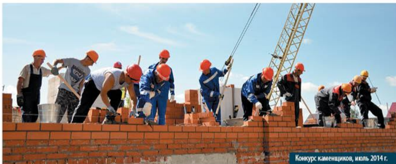
Конкурс каменщиков, июль 2014 г.

основных блока: соблюдение организацией требований внутренних документов партнерства (22 балла), требований к выдаче свидетельства о допуске (36 баллов), осуществление контроля качества (10 баллов), соблюдение охраны труда, промышленной и экологической безопасности (32 балла). Мы составляем список замечаний, рекомендуем провести определенную работу по их устранению, только после этого проверка считается закрытой. В 2014 году было проведено 1228 проверок, в том числе 1188 плановых. При этом 117 организаций (10%) прошли проверку без замечаний, 784 (66%) – устранили замечания в установленные сроки, 155 (13%) компаний были направлены на рассмотрение