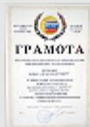
Грамота Российского Союза строителей