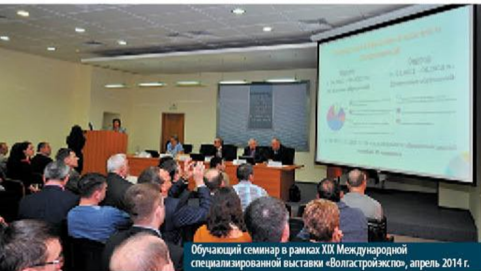
Обучающий семинар в рамках XIX Международной специализированной выставки «Волгастройэкспо», апрель 2014 г.

– Мы стремимся к тому, чтобы исключить несчастные случаи на стройках, поэтому уделяем вопросам охраны труда и техники безопасности особое внимание. Компании, входящие в Содружество, на безвозмездной основе обеспечены документацией по охране