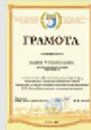
Грамота Союза строителей Республики Татарстан

ЗА ЗНАЧИТЕЛЬНЫЙ ВКЛАД В РАЗВИТИЕ СТРОИТЕЛЬНОЙ ОТРАСЛИ РЕСПУБЛИКИ, АКТИВНУЮ ОБЩЕСТВЕННУЮ ДЕЯТЕЛЬНОСТЬ И МНОГОЛЕТНЮЮ ПЛОДОТВОРНУЮ РАБОТУ ВЫСШЕЙ ГОСУДАРСТВЕННОЙ НАГРАДОЙ РЕСПУБЛИКИ ТАТАРСТАН – ОРДЕНОМ «ЗА ЗАСЛУГИ ПЕРЕД РЕСПУБЛИКОЙ ТАТАРСТАН» НАГРАЖДЕН: